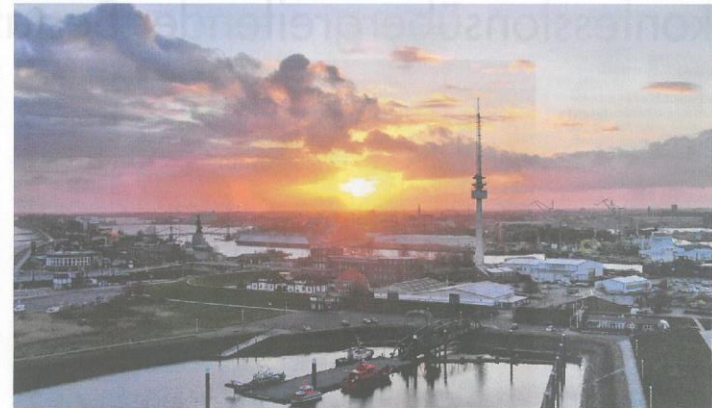
Die Lage am Wasser macht den Süden Wilhelmshavens besonders reizvoll und anziehend.

Der sanierte historische Banter Markt mit dem modernen Familienzentrum Süd ist zu sehen, aber auch der Gotthilf-Hagen-Platz, der Valoisplatz und die Jadeallee als Verbindung von Innenstadt- und Freizeitbereich. Das im Bau befindliche Trilateralale Wattenmeer Wattenmeer Partnerschaftszentrum im Banter See Park. Und last but not least rückt im-