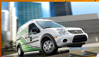
Ford Transit Connect BEV 2010 für den US-Markt

Renault: weltweit größter Elektro-LKW in Lyon (Frankreich)